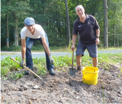
een eind op weg

enkele particuliere tuinen. Op de foto's twee stadia van verwijdering van JDK.