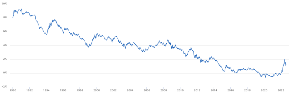
Historische data kapitaalmarktrente rente 10 jaar

In bovenstaande grafiek ziet u het historische verloop van de Nederlandse kapitaalmarktrente.