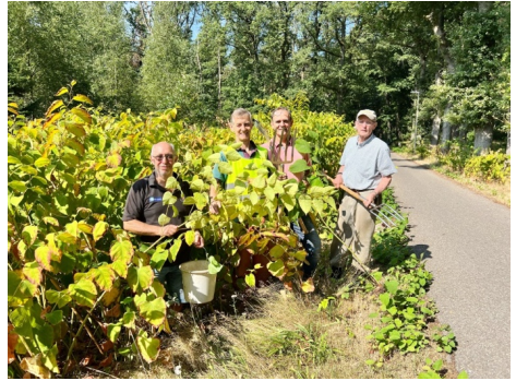
alles moet nog gebeuren

Wij kunnen u helpen bij uw inzet om die te verwijderen. Maakt u contact met een van ons, dan komen we langs. En wij kunnen altijd versterking van de groep gebruiken!