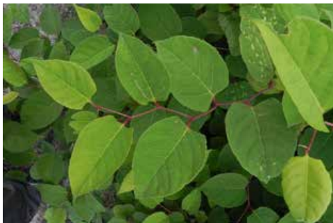
Bladeren van de Japanse duizendknoop