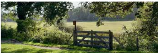
Uitzicht op het Renkums Beekdal vanaf het bezoekerscentrum

Voorafgaand aan de bijeenkomst is de koffie en thee gratis. Na afloop bij de borrel in de bar gelden de prijzen van Nol in't Bosch.